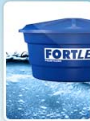
Caixas em Fibra e Polietileno pág. 4