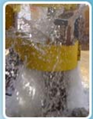
Poços pág. 4