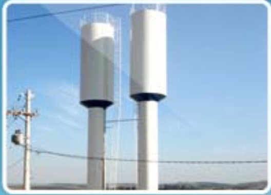
Caixas d'água metálicas pág. 2