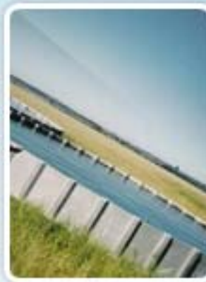
Reservatório Australiano pág. 3