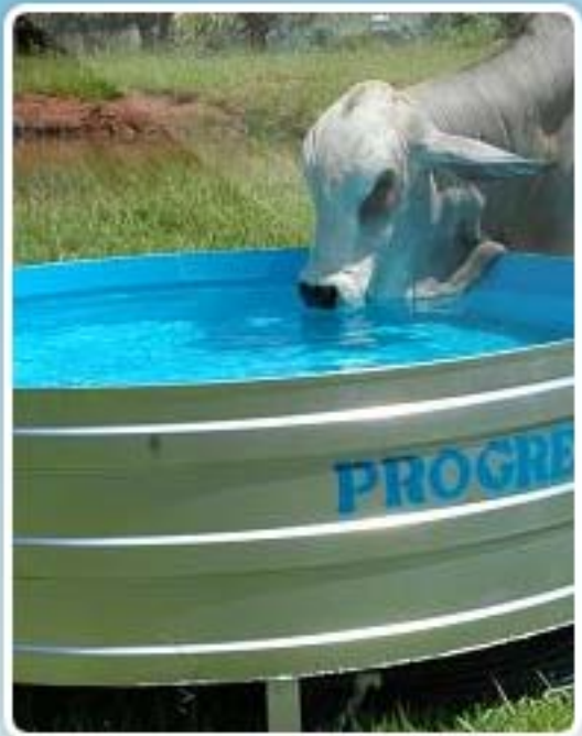
Bebedouro metálico pág. 3